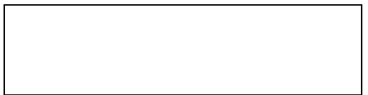
Схема границы балансовой принадлежности

д) границей эксплуатационной ответственности объектов централизованной системы водоотведения организации водопроводно-канализационного хозяйства и заказчика является: