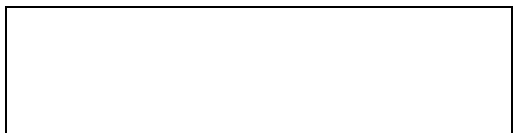
Схема границы балансовой принадлежности

е) границей эксплуатационной ответственности объектов централизованной системы холодного водоснабжения организации водопроводно-канализационного хозяйства и заказчика является: